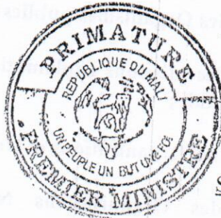
Soumeylou Boubèye MAIGA